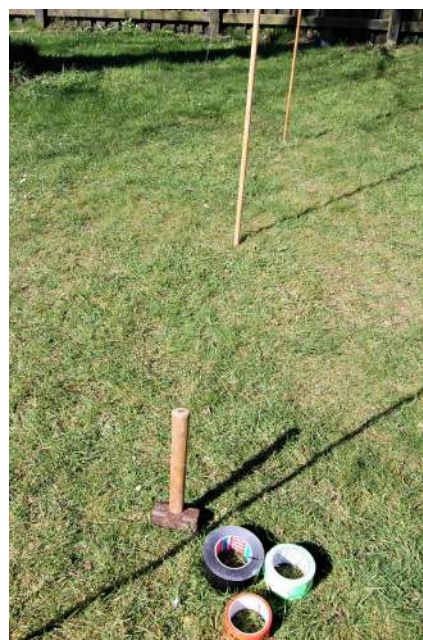
Lodrette rundstokke og farvet tape