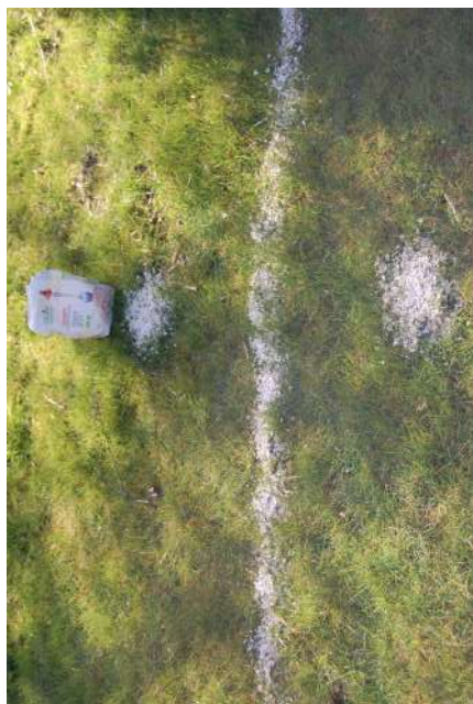
Havregryn som markering i skoven