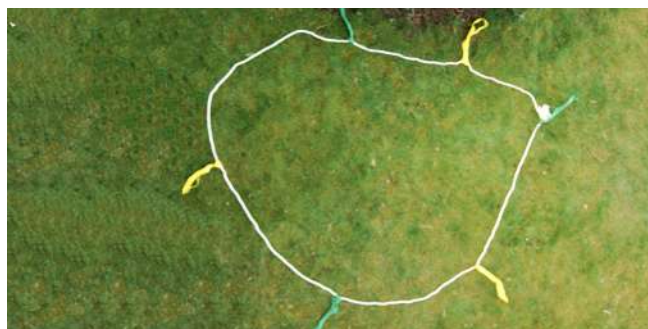
Tov med markering. Opdelt i et gult og et grønt hold